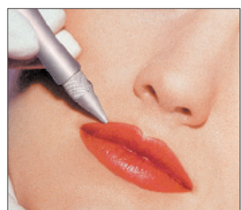
So gut gelingt es einem meist selbst nicht, seine Lippen zu schminken.

Kontakt Institut barbara – daniela: Tel. 05 12/90 10-4034, 4035 (Fax) oder 06 64/54 35 015.