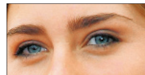
Wieder schöne Augen.

Unser Gesicht wandelt sich mit zunehmendem Alter, dennoch können die natürlichen Züge betont und verschönert werden. Hängelider können z. B. mit einer ambulanten Operation in örtlicher Betäubung behandelt werden. Krähenfüsse werden durch Injektion von natürlicher Hyaluronsäure (Restylane) geglättet. Mimische Falten wie z. B. die Zornesfurchen werden durch BOTOX® entspannt.