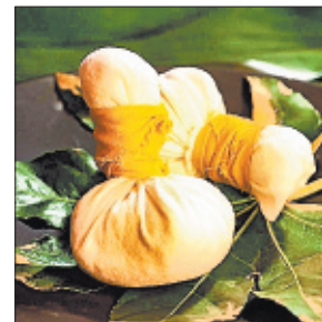
Pantai Luar – eine ostasiatische Ganzkörpermassage.